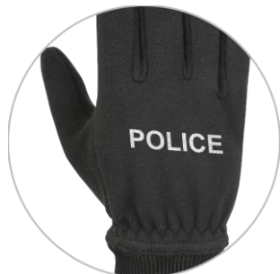
možnost individuálního potisku