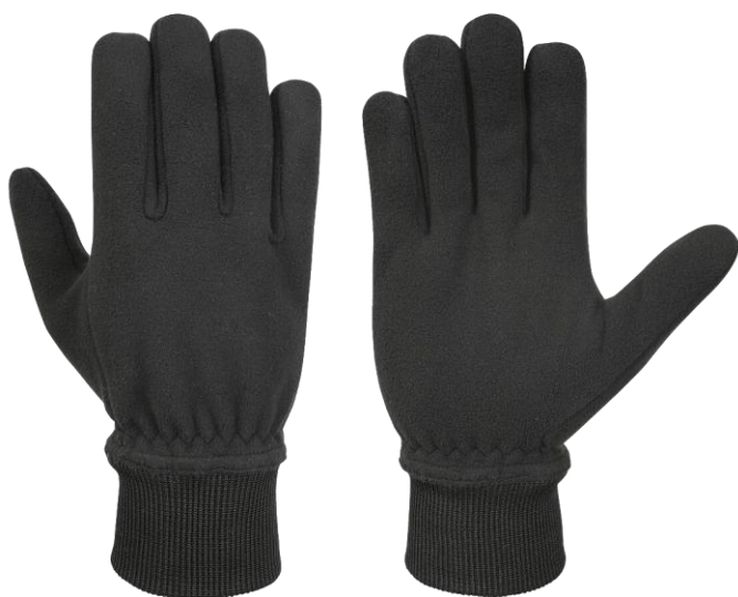
PARKER POLICE Short Black