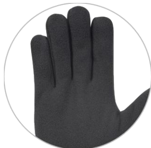
přiléhavý komfortní střih